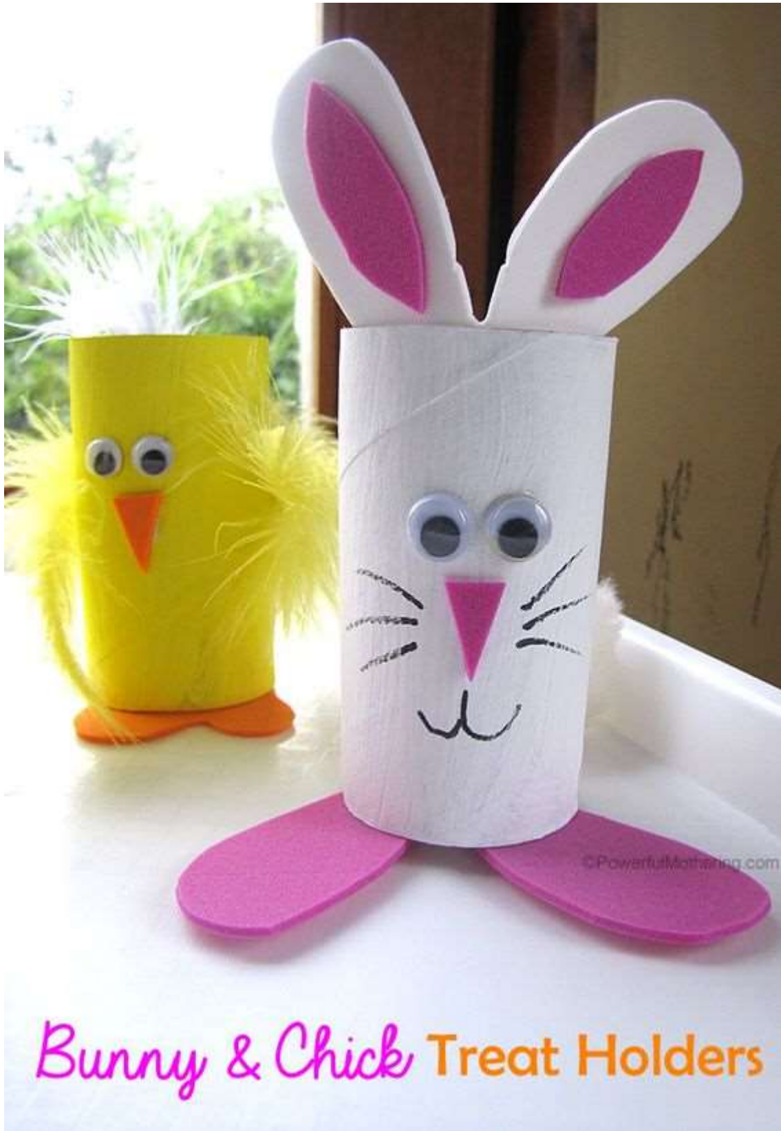
Bunny & Chick Treat Holders